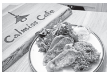
ワンプレートランチの一例 (ポークジンジャー)

心もからだにも満足すること間違いなしなおしゃれカフェ。皆さんもぜひ足を運んでください。